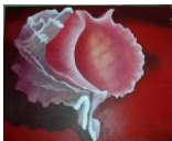
Figure 2. Coquillage 2 . Acrylique. 61,9 X 76,2 cm; 2008-2009.